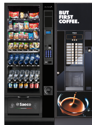
Artico M + Oasi 600