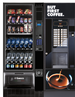
Artico S + Oasi 400