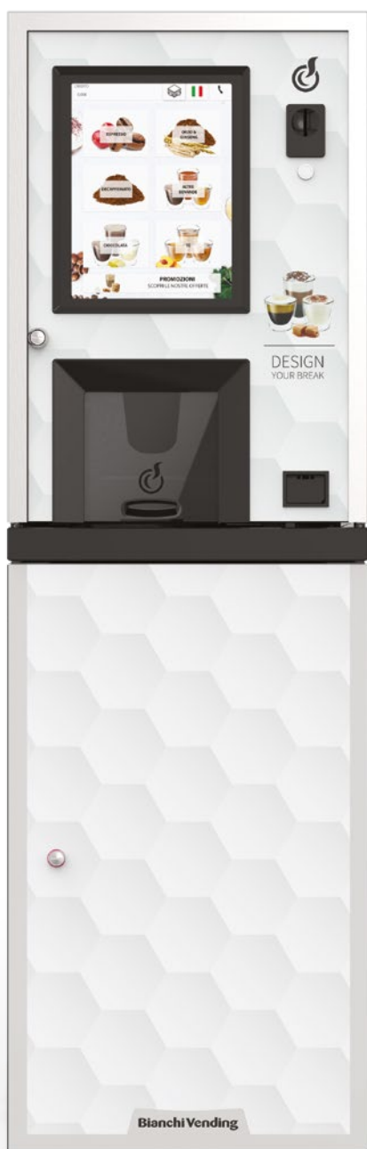
LEI250 TOUCH15" + MOBILETTO + KIT ADESIVO CON GRAFICA "DESIGN YOUR BREAK" IN OPZIONE